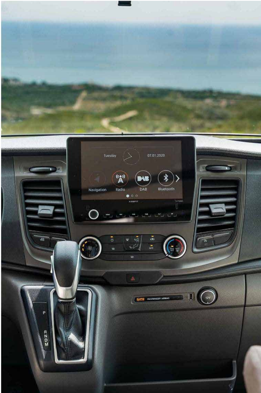
Radio z monitorem 9cali Xzent F280 – w pakiecie NORS